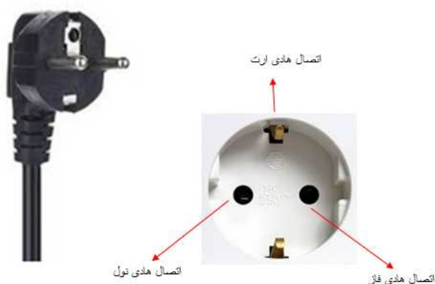
شکل (۳) - نحوی اتصال صحیح سوکت آزمون دستگاه

*متأسفانه برخی موارد رؤیت شده است که برق کار اشتباه هادی فاز را به ترمینال ارت در پریز متصل نموده است که در صورت اتصال تجهیز برقی می تواند بسیار خطرناک باشد.