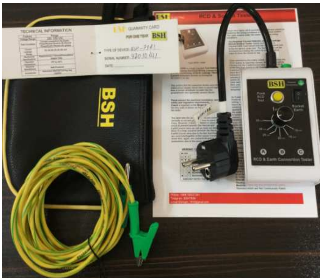
شکل (۱)-نمای بیرونی دستگاه تستر مدل BSH-7381

یکی از مزایای استفاده از این تستر بالا بردن سرعت عمل در آزمودن و بازرسی بدون نیاز به باز کردن مکانیسم پریز، بررسی سیستم ارتینگ منازل و جلوگیری از برق گرفتگی به دلیل خرابی کلیدهای نشستی جریان و یا قطع بودن سیم ارت در پریزها است.